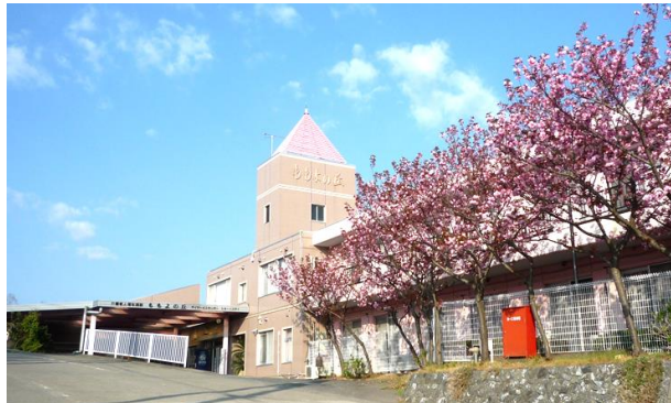
特別養護老人ホーム ももよの丘