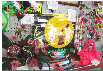
ふれあい作品展 展示