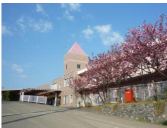
特別養護老人ホーム ももよの丘

多種多様なニーズに合わせたケアと、きめ細やかなサービスの提供が、ヘルパーステーションももよの丘の特徴です。