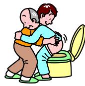
トイレ介助その他